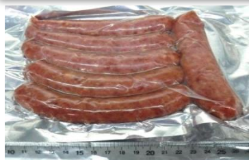
携行品の豚肉ソーセージ

11月9日に中国の大連から成田空港に到着した旅客の携行品（豚肉ソーセージ、2.5kg）を動物検疫所が検査したところ、アフリカ豚コレラウイルスの遺伝子を確認されました！