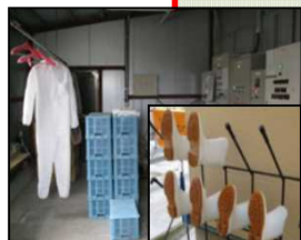
専用の服や靴の使用