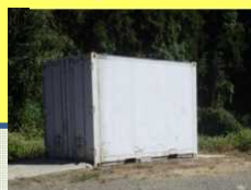
死亡家畜の適切な保管 (例:コンテナ保管)