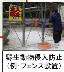
野生動物侵入防止 (例:フェンス設置)