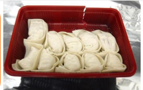
携行品の自家製餃子

10月14日に上海から羽田空港に到着した 旅客の携行品(自家製餃子、非加熱)を動物 検疫所が検査したところ、アフリカ豚コレラ ウイルスの遺伝子を確認されました！