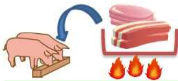
中国におけるアフリカ豚コレラの発生状況

生肉を含み、又は含む可能性がある飼料を給与する場合は、 加熱処理が適切に行われたものを給与してください！